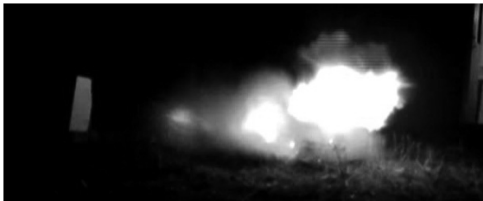
Kanonexplosionen vid Heimmotet i Nordbyn, 2004

Delarna befinner sig nu på Ovako Ståls forskningsavdelning där analys av splitter förhoppningsvis skall utröna om det var materialfel