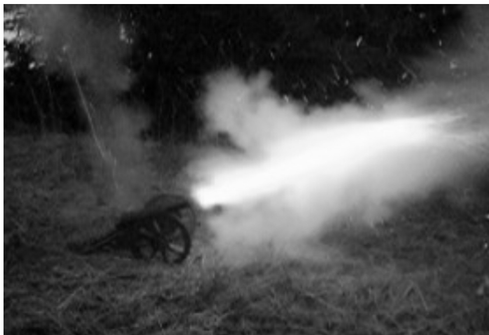
Den första provskjutningen med den nya salutkanonen