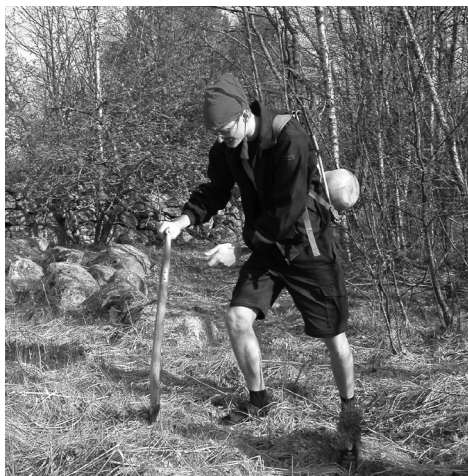
Inplantering av tallplant från Jamtland på Svartlöga. Ömotet 2004

Enligt många bröder verksamhets-årets kanske trivsammaste Mot - Ömotet på br Stj Sandlers sommarställe på ön Svartlöga bjöd på fantastiskt väder och inplanteringen av tre jamtska tallplant på ön.