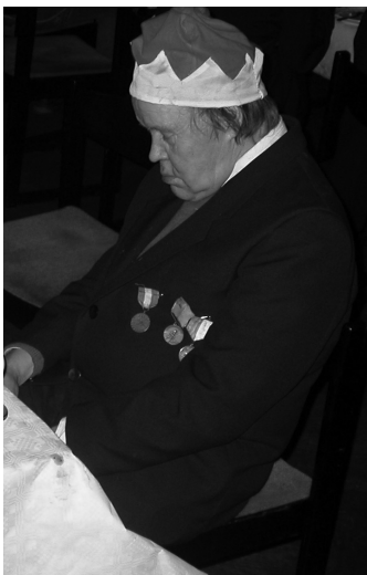
Artikelförfattaren på Julmot 2004

repriserade en halvsula Ljunglöv och med näbben full marcherade jag på lätta fjät in bland nasarnas och månglarnas alla stånd av skabbade rävskinn, hopsnurrade oxsvansar och pillgrimmade knivskäft, allt på jakt