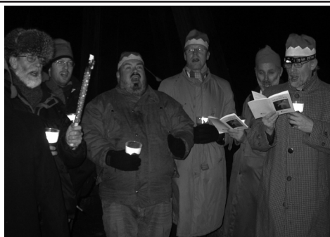
Jamtkören med br Stj HP Burman

Broder Storjamen ser ju inte ut att svälta, men nog borde han ta en prat med Stim och påtala att han är den mest spelade tonsättaren i Jamtland! Det borde rendera i en