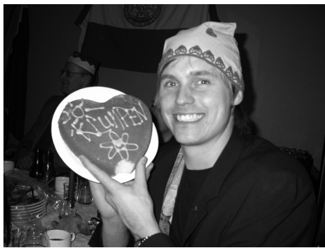
Velourjamt på Valmot 2004

Valmot hölls. Bra beslut togs. Så kom Styrelsens årliga belöning, Smaken.