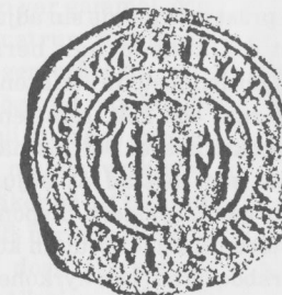
Jamtlands andra sigill 1575-1614